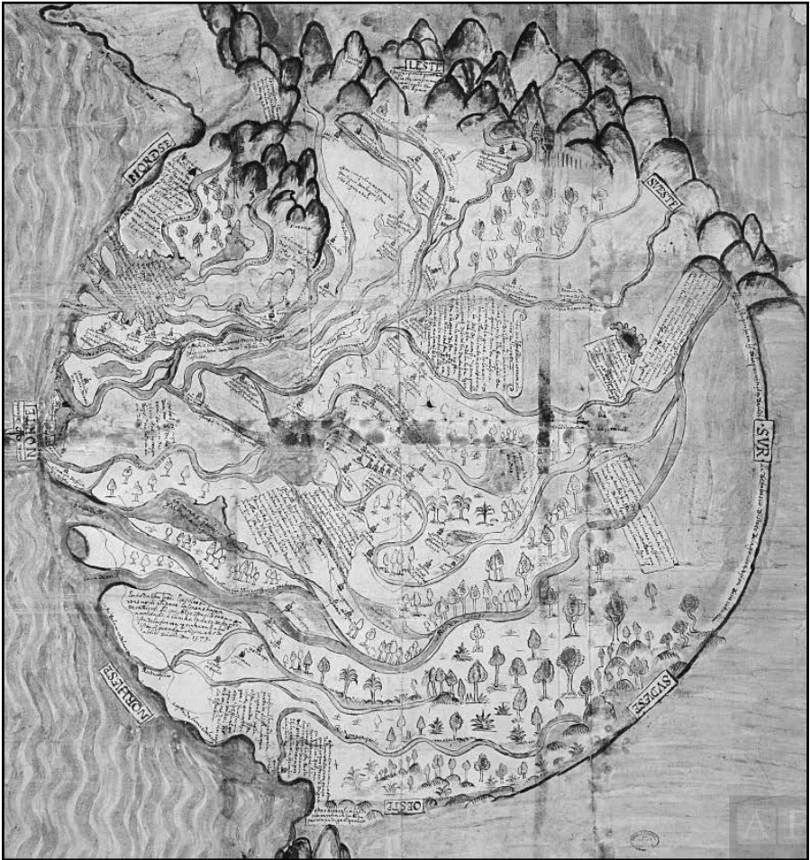
Mapa de la Relación de Tabasco , 1579.

Este mapa lo envió a la Corona un español llamado Melchor de Alfaro Santa Cruz, pero su estilo sugiere un origen indígena. El original tiene dimensiones impresionantes: cincuenta y siete por sesenta centímetros. Coatzacoalcos aparece a la derecha.